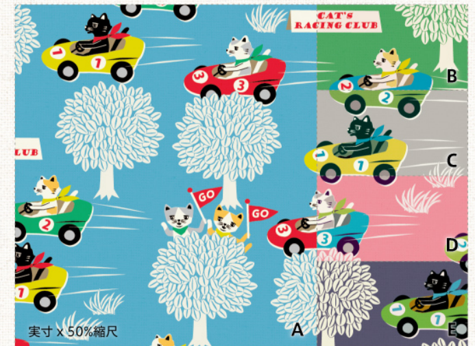
‘Cat's Racing Club’ (キャッツレーシングクラブ) | sheeting | CO112507

ふわふわな雲や草花の中に、ロバ、ブタ、アルパカ、トリにチョウチョ ...。天気の良い屋下がりの高原にたゆたう、夢見心地の風景のようなファブリックです。図案同様に軽やかなローン生地は、服地などにもおすすめです。