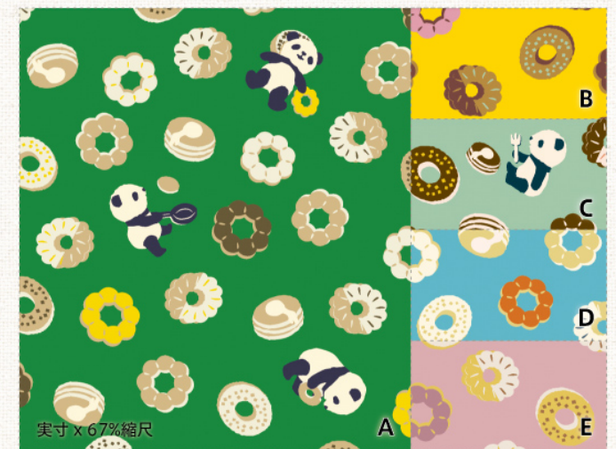
‘Panda Loves Sweets’ (パンダラブススイーツ) | sheeting | CO112508

にこにこお陽さまに微笑むような花達と、ひらひらとそよぐチョウチョ。親しみやすいリズムカルなパターンで、使い勝手抜群のファブリック。帆布に近いしっかり厚手の生地は、エプロンやバッグ類他、インテリアアイテム用にも最適です。