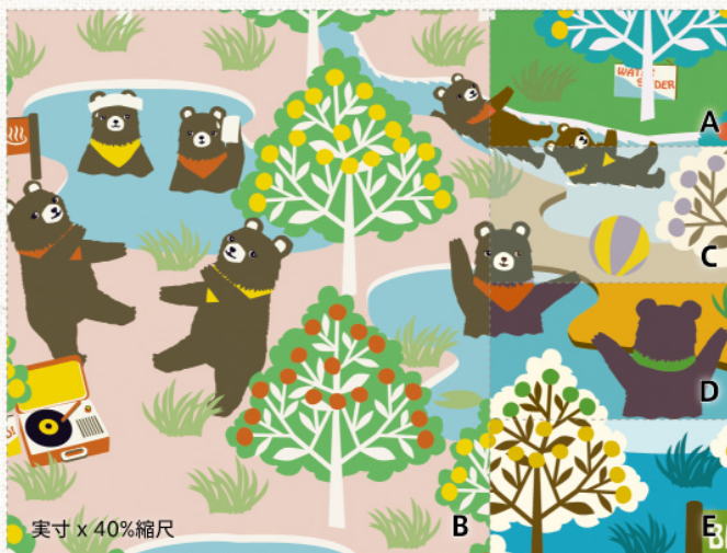
‘Bear's Resort’ (ベアーズリゾート) | oxford | CO152142

腕利きの猫達によって結成されたレーシングクラブ。磨き上げたレーシングカーとテクニックで、今日も森のサーキットを颯爽と駆け抜けます。楽しく個性的な絵柄は、お子様の入園入学アイテムなどにもおすすめです。