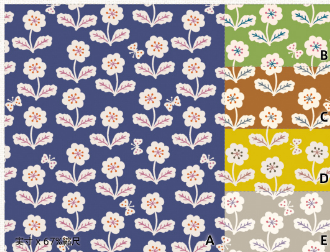
‘Smiley Flowers’ (スマイリーフラワーズ) | 10 oxford | CO152138

とある森の中にある、クマ達によるクマ達のためのリゾートランド。水遊びにダンス、釣りに温泉 ...、楽しみはいつまでも尽きません。*この大柄生地 (厚手オックス生地) で作れる可愛いトートバッグレシピを、コトリエヌ HP にて公開中。